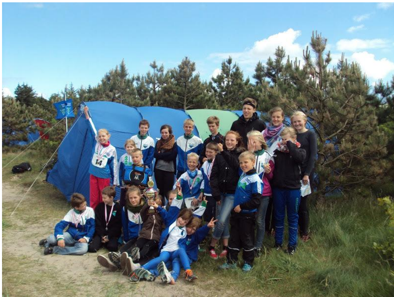
Fra Skovcup-finalen 2012