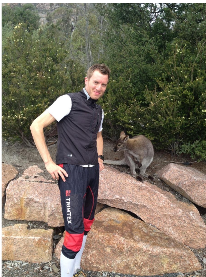
Rune med kænguru

Det er mange historier i eventyrsamlingen lige fra overnatning på svinefarm i det jyske, nat-orienterings gyser i Tyrkiet med lyn, torden og bedemusik hængende mellem træerne til galop med kænguruer og farlige slanger i den australske bush.