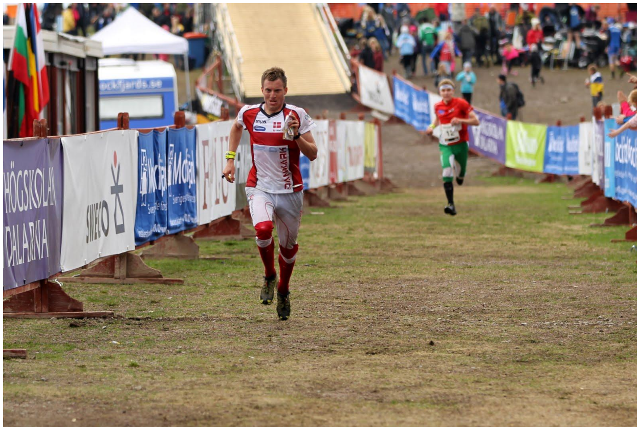
Rune ved EOC 2012

Der tages i ovenstående forbehold for at mit modersmål er skandinavisk efter at have boet i Danmark, Sverige og nu Norge og der endnu ikke er udarbejdet en Run'sk – Dansk ordbog så ovenstående er for eget ansvar for læseren!