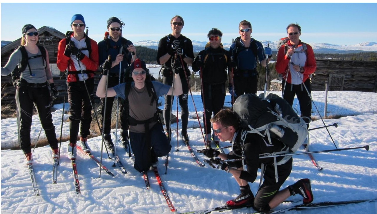
Rune på langrend

Når enden er god er alting godt. Efter ophold i Sverige og Australien er jeg er nu så privilegeret at jeg holder til i Oslo og har fantastisk Nordmarka ikke langt udenfor døren, der tilbyder fantastisk terræn både sommer og vinter. Som dansk i Norge lærer man hurtigt at langrend er det alle snakker om, og jo det er kommet en del frække bemærkninger i retning af den danske knægt, når emnet ryger i den retning. Træningen har helt naturligt bestået af langture på ski i løbet af vinterhalvåret, det har betydet mange timer i skisporet, mere end en god håndfuld Hot Choco & vafler, og et par skikurser senere er håneretten ved at være på min halvdel overfor de andre på kontoret.