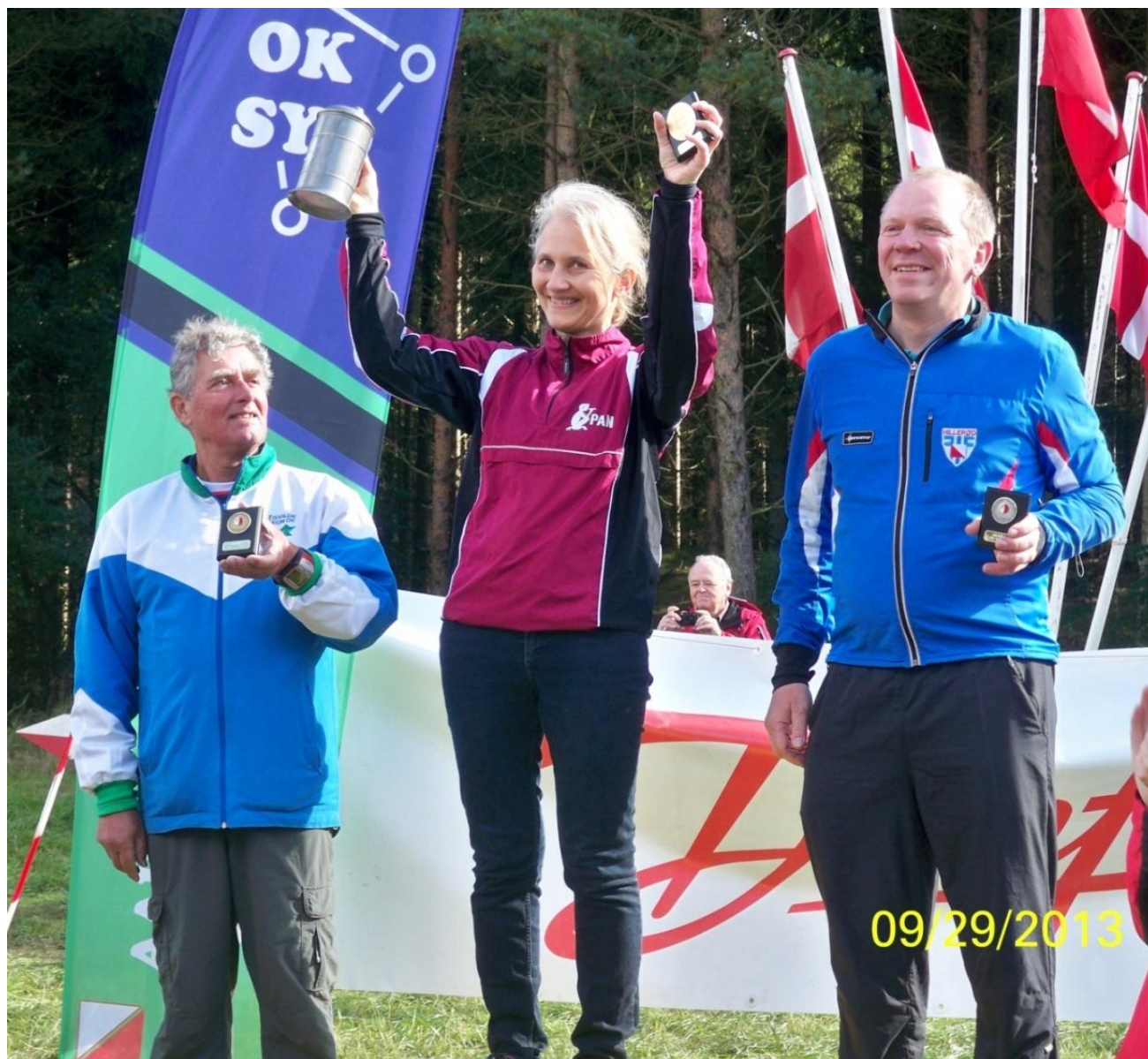
Dan på præmieskamlen sammen med repræsentanter for Pan og Hillerød.

Vores løbere opnåede følgende placeringer (for hver af de pointscorende løbere er nævnt det samlede antal point i de fem matcher):