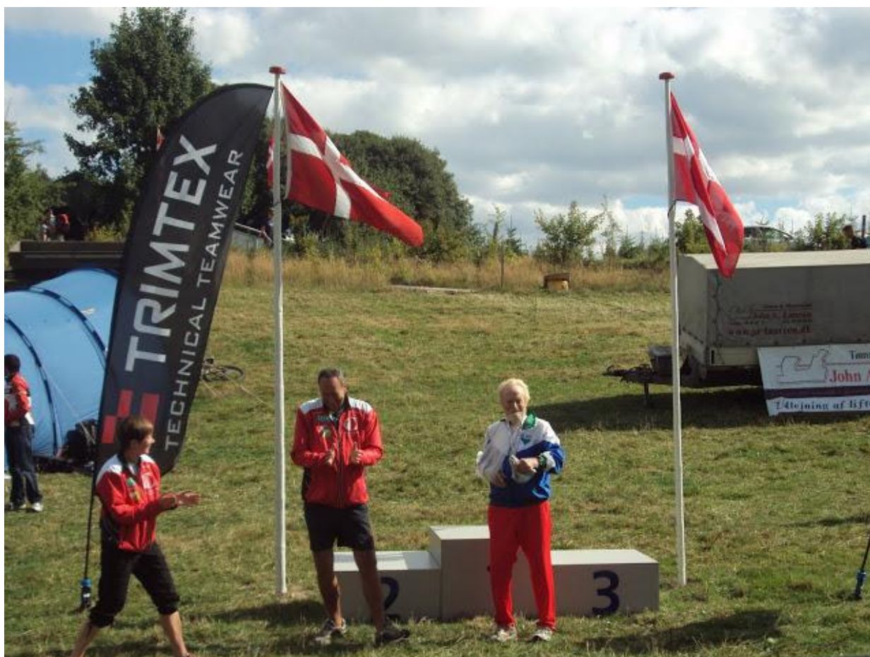
Røde som guldvinder ved DM-mellem