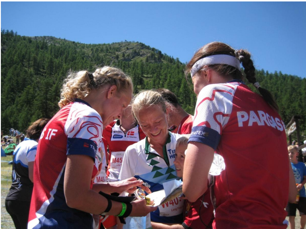
En snak med konkurrenter lige efter målgang

Endnu en fantastisk oplevelse i fantastiske omgivelser.